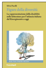
FIGURE DELLA DIVERSITÀ.

La narrazione sostiene lo sviluppo dei bambini e rafforza le relazioni. Il libro invita gli adulti a usare le storie in modo consapevole, offrendo esempi e strumenti per comunicare meglio e costruire significati condivisi.