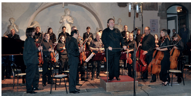
L'Orchestra da Camera Fiorentina